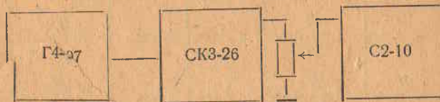
Рис. 6. Структурная схема измерения погрешности установки коэффициента глубины модуляции.

В диапазоне частот 340—400 МГц измерения проводятся в соответствии со структурной схемой, приведенной на рис. 6.