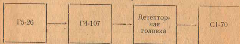
Рис. 9. Структурная схема измерения длительности выходных импульсов генератора.

0,3 и 10 мкс в диапазоне частот генератора свыше 50 МГц в структурной схеме, приведенной на рис. 9.